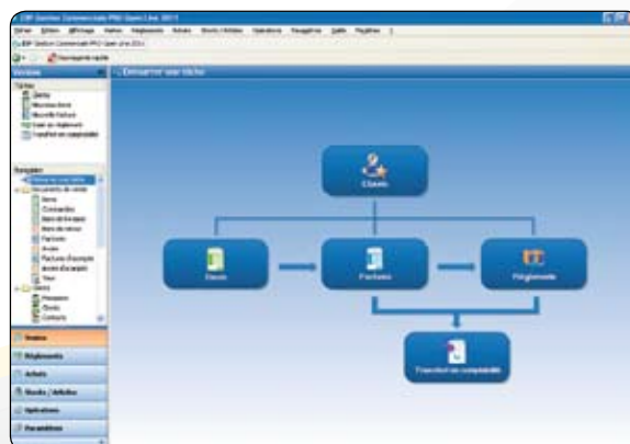
L'Open Guide : l'assistant de navigation