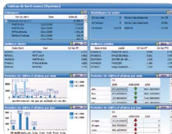
Le tableau de bord totalement personnalisable